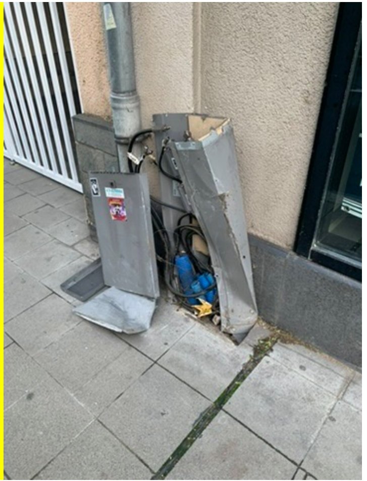
28 septembre 2024 Sortie de route dans la nuit du vendredi au samedi