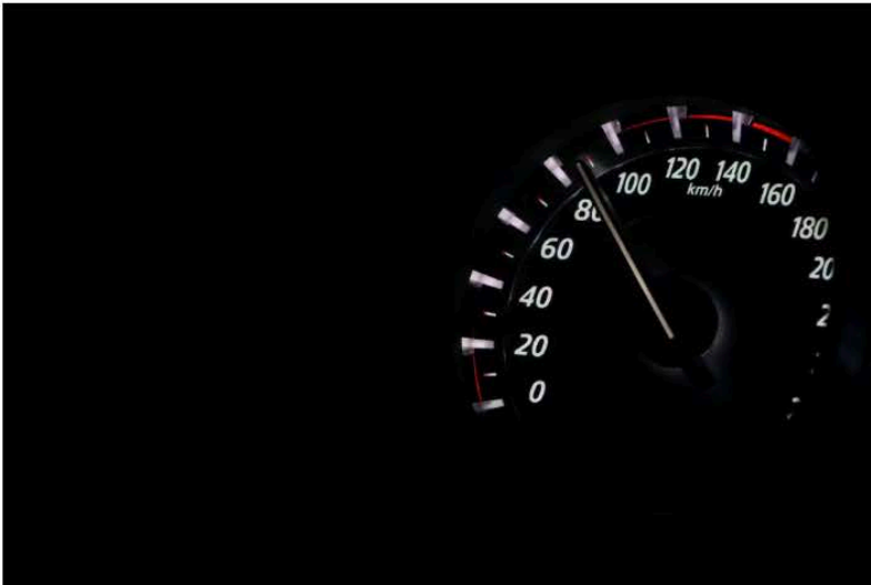
On ignore à quelle vitesse il roulait.

Depuis vendredi, la police a eu affaire à plusieurs d'automobilistes sous l'effet de l'alcool. Des blessures plus graves ont heureusement été évitées.